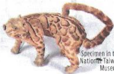
Specimen in the National Taiwan Museum