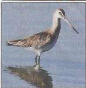
WINGED WONDERS: (From top) Fulvous whistling duck, common sandpiper, ruff and black-tailed godwit at the Pallikaranai marshland