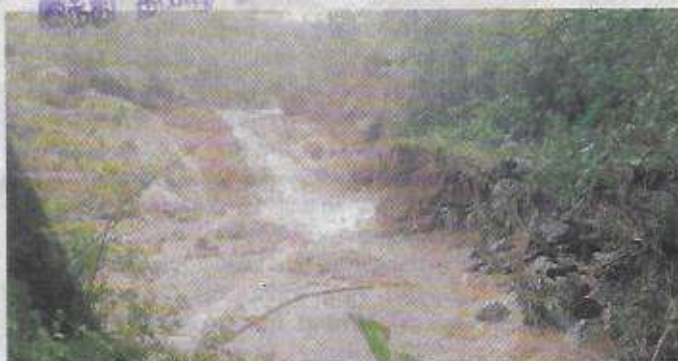
▲ பைரப்பள்ளி சாணிகணவாய் பகுதியில் தடுப்பணை உடைந்ததால் வெள்ளப்பெருக்கு ஏற்பட்டுள்ளது.

சாணிகணவாய் பகுதிகளில் வளத் துறை சார்பில், கடந்த 2 ஆண்டுகளுக்கு முன்பு ரூ.8.50 லட்சம் செலவில் கட்டப்பட்ட தடுப்பணை நேற்று பெய்த கனமழைக்கு உடைந்தது. இதனால், மழைநீர் அருகேயுள்ள ஊருக்குள் புகுந்தது. அதேபோல், பெரியவரிக்கம், விண்ணமங்கலம் உள்ளிட்ட பகுதிகளில் குடியிருப்பு பகுதிகளில் மழைநீர் புகுந்ததால்