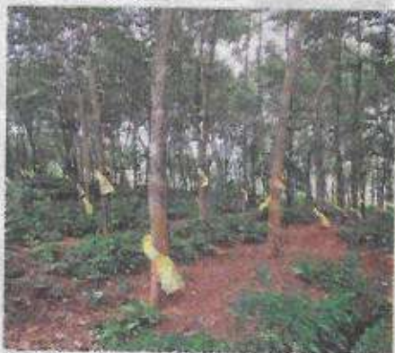
Rubber plantation in Kanyakumari