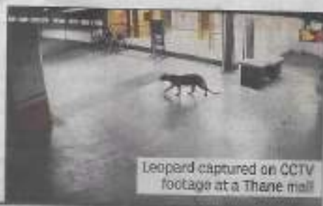
Leopard captured on CCTV footage at a Thane mall