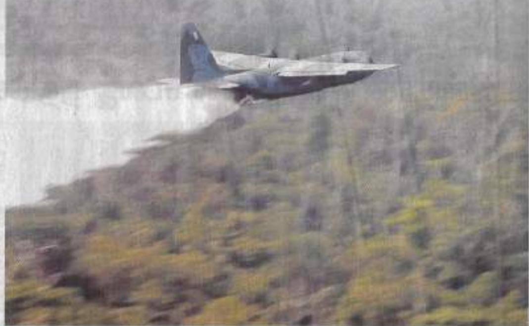
▲ அமேசான் காட்டுத் தீயை தண்ணீரைப் பாய்ச்சி அணைக்கும் பணியில் ஈடுபட்டுள்ள போர் விமானம்.