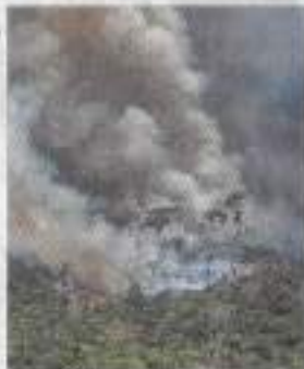
Smoke billowing from forest fires close to Porto Velho on August 24.

Brazil's President Jair Bolsonaro has ordered an investigation into reports that rural producers in the northern state of Para held a "day of fire" on August 10 in a show of support for the far-right leader's efforts to weaken environmental protection monitoring in the region.