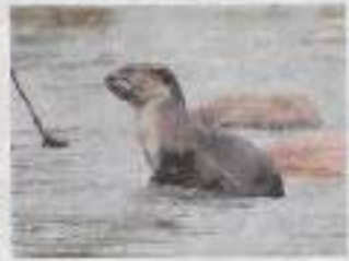
A star tortoise and, right, a smooth-coated otter.

The upgradation was approved at the Conference of the Parties (COP18) held at Geneva.