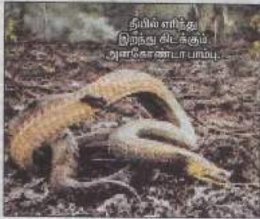
தீயில் எரிந்து இறந்து விடக்கூம் அனகோண்டா பாம்பு.

அமேசான் தீப்பற்றி எரிவதால் ஆக்சிஜன் பற்றாக்குறை ஏற்படும் என்று விஞ்ஞானிகள் எச்சரிக்கிறார்கள்.