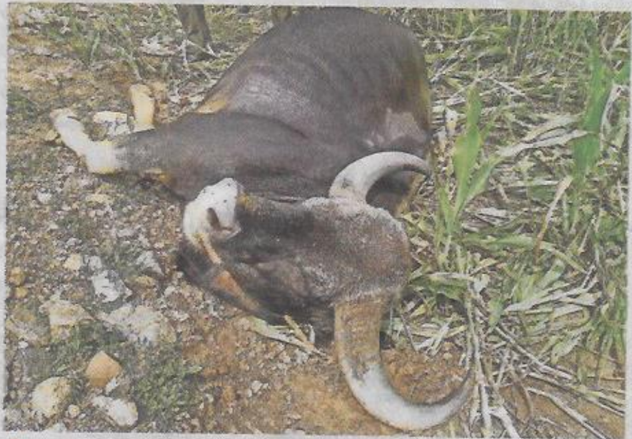
■ தர்மபுரி மாவட்டம், பாப்பிரெட்டிப்பட்டி அடுத்த பாப்பம்பாடியில், மின்வேலியில் சிக்கி இறந்த காட்டெருமை.